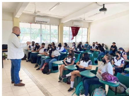
Conferencia: "Cultura de legalidad y Equidad de Género"