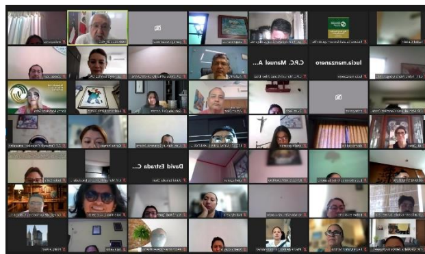
Capacitaciones marzo 2023

la corrupción, como punto de partida para intervenciones públicas coordinadas, efectivas y orientadas a resultados.