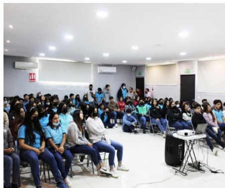
Conferencia: "Ética y las adicciones"