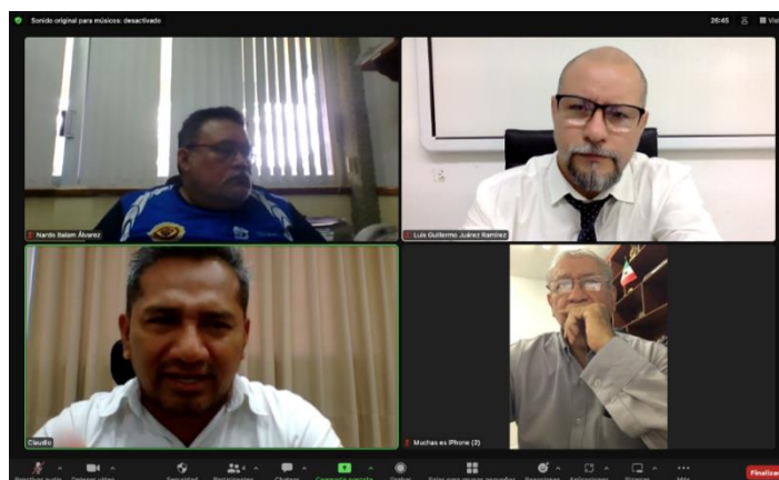
Reunión con presidentes de Comités

De igual manera, se realizó una reunión con los presidentes de los comités estudiantiles de la Universidad Mesoamericana de San Agustín y del Tecnológico Nacional de México campus Motul, con la finalidad de organizar sesiones de capacitación al personal administrativo y docente de dichas instituciones educativas con temas relacionados a las responsabilidades administrativas e Integridad profesional.