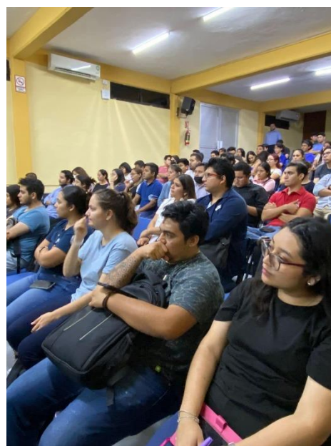
Plática de la PEAY en la FCA de la UADY