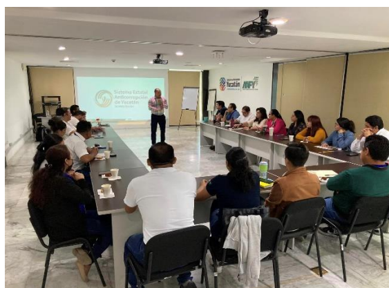
Evento de difusión Responsabilidades Administrativas en el Servicio Público